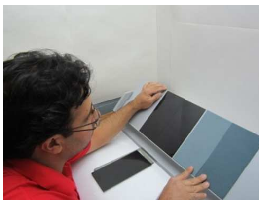
شکل ۲: ارزیابی چشمی در شرایط نوردهی پراکنده.

به منظور فراهم نمودن شرایط نوردهی کابینت نوری از کابینت نوری استاندارد استفاده گردید و کلیه آزمون‌های چشمی تحت منبع نوری استاندارد D65 انجام شد. در این شرایط شار نوری در فاصله ۵۰ cm از سطح نمونه در حدود ۱۰۷۰ لوکس و دمای رنگ همبسته منبع نوری ۵۷۰۰ درجه کلوین بود. در شکل ۳ این شرایط نوردهی نشان داده شده است.