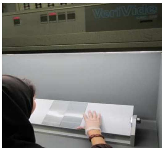
شکل ۳: ارزیابی چشمی در شرایط نوردهی کابینت نوری استاندارد.